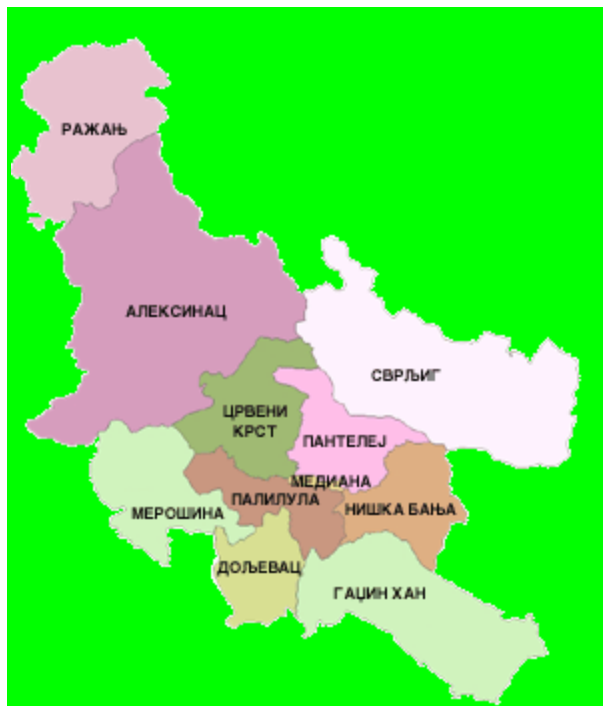
Положај општине Ражањ у Нишавском округу