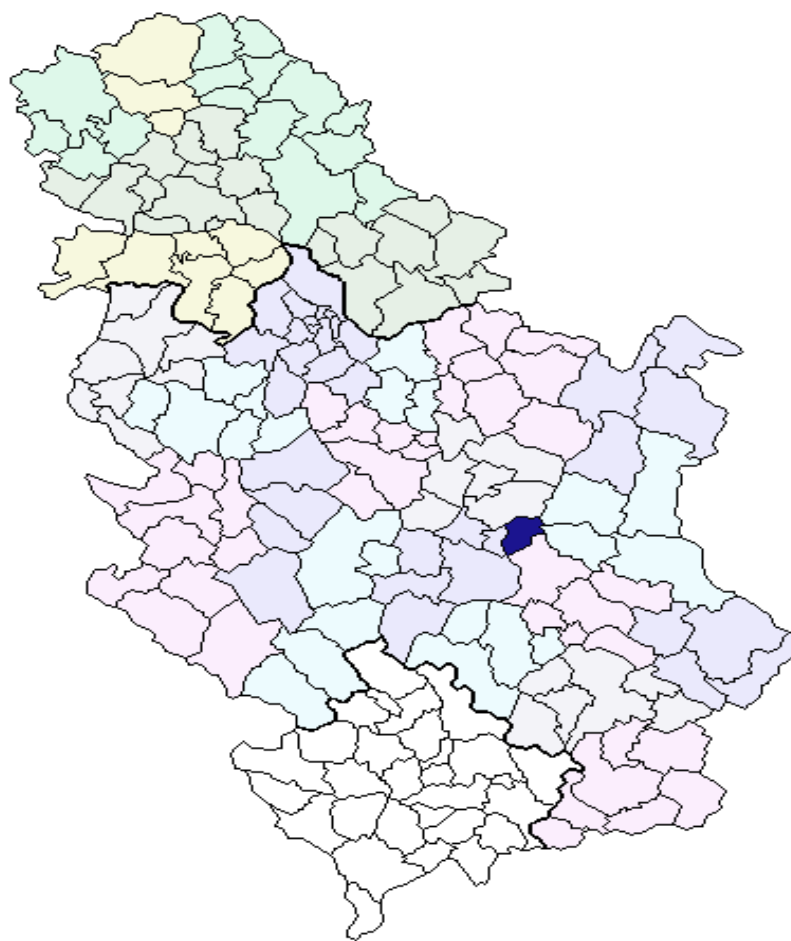
Положај општине Ражањ у Републици Србији